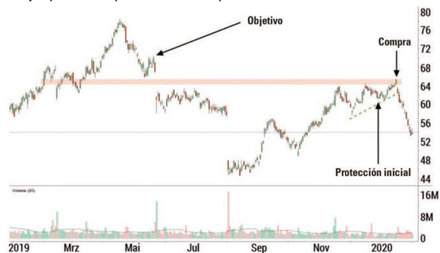
G4 Ejemplo de una operación "de éxito" perdedora

En el gráfico, podrá ver una configuración de entrada a largo al romper por encima del máximo de la tendencia de NetApp. El historial del gráfico mostró el rango entorno al máximo de tendencia bajista a $ 70.42 como precio objetivo. Se usó el mínimo de $ 60.90 para la protección inicial del trading. Sin embargo, después de la ruptura, el precio se movió rápidamente en la dirección opuesta y rompió el mínimo anterior de la tendencia alcista, por lo que la posición tuvo que cerrarse con una pérdida. El movimiento posterior de los eventos revela cuán importante es la limitación constante de las pérdidas. Si bien la posición negociada registró una pérdida de USD 3.60 por acción, sin cobertura, ¡hubiera superado los USD 10 solo unos días después! A este respecto, los traders deben evaluar mentalmente sus posiciones, donde tienen que salir para limitar las pérdidas, como correctas y, por lo tanto, de éxito en términos del proceso de negociación.